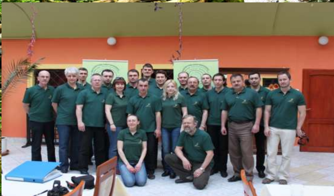
Фото на згадку учасників проекту HUSKROA

Проект HUSKROUA 1001/028 «Безперервне навчання лісівників задля кращого ведення лісового господарства» в рамках Програми прикордонного співробітництва ЄІСП Угорщина-Словаччина-Румунія-Україна 2007-2013