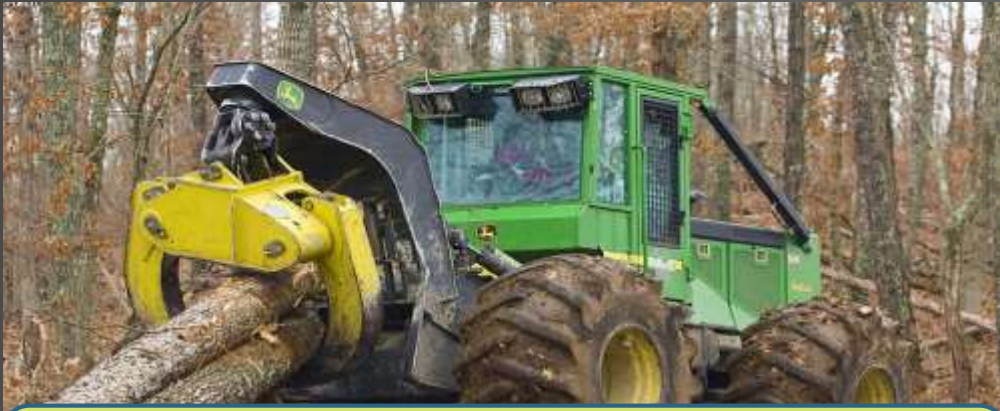
Український державний лісотехнічний університет, 2001, Лісоінженерна справа, кваліфікація інженер – технолог