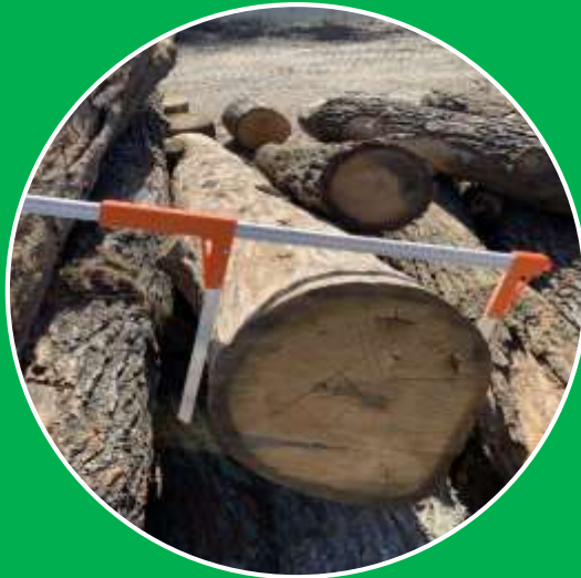
Лісова таксація і лісовпорядкування