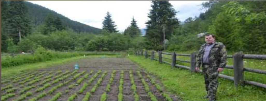
Український державний лісотехнічний університет, 2005, Лісове господарство, кваліфікація спеціаліст з лісового господарства