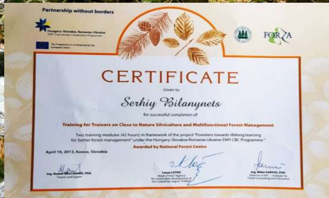
Сертифікат тренера з наближеного до природи лісівництва та багатофункціонального ведення лісового господарства