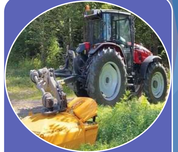
Механізація лісового господарства